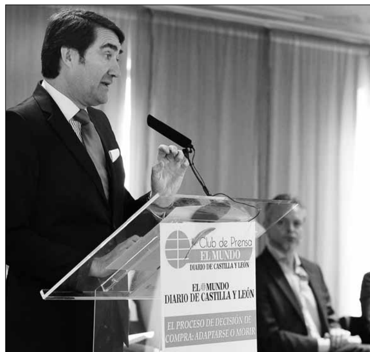
El consejero, en su intervención en el acto.

El titular de Fomento precisó que las empresas de telecomunicaciones ofrecen hasta 300 megas pero, a su juicio, «la llegada de la banda a los 95.000 kilómetros cuadrados de población dispersa es una prioridad». El consejero añadió que en internet «no solamente se trata de vender sino de recibir información y que cada vez están más extendidos medios como la banca electrónica o la firma digital, por ejemplo».